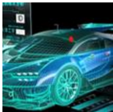
智能交通与自动驾驶