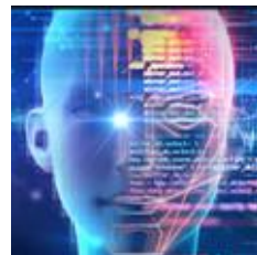
深度学习训练与推理