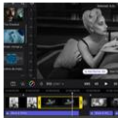
图像与视频智能处理